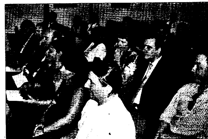
■ Abogados llegados de toda Andalucía han participado en el encuentro.