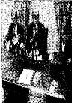
Representantes del Colegio de Abogados, ayer en la presentación.

Abordar algunos de los cambios que afectan a la labor de los abogados, entre ellos los nuevos requisitos para el acceso a la profesión que en breve entrarán en vigor, es uno de los objetivos principales del II Congreso de la Abogacía Extremeña que se celebrará en la ciudad los días 24 y 25 del presente mes. También se tratarán en el mismo otros temas de interés, como las nuevas tecnologías o los honorarios de los abogados.