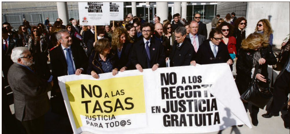
Una de las múltiples protestas que provocó el 'tasazo' en la Ciudad de la Justicia de Murcia. JUAN CABALLERO

► Por poner un ejemplo claro, que evidencie lo que ha supuesto la supresión del 'tasazo', nos centramos en el ámbito social para destacar que desapareció la tasa de 500 euros para interponer recurso de duplicación y de 750 euros para interponer recurso de casación. Quedan vigentes, no obstante, al no haber sido objeto de recurso, las tasas fijadas en el orden civil establecidas con anterioridad a la ley 10/2012.