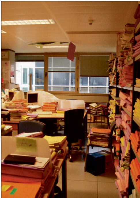
Los litigios han aumentado en los últimos años. VICENT M. PASTOR

De hecho, en 2016, los ingresos por tasas judiciales en la Región de Murcia fueron de menos de dos millones de euros (1,9), un 34% menos que el año anterior. Desde la supresión del sistema de