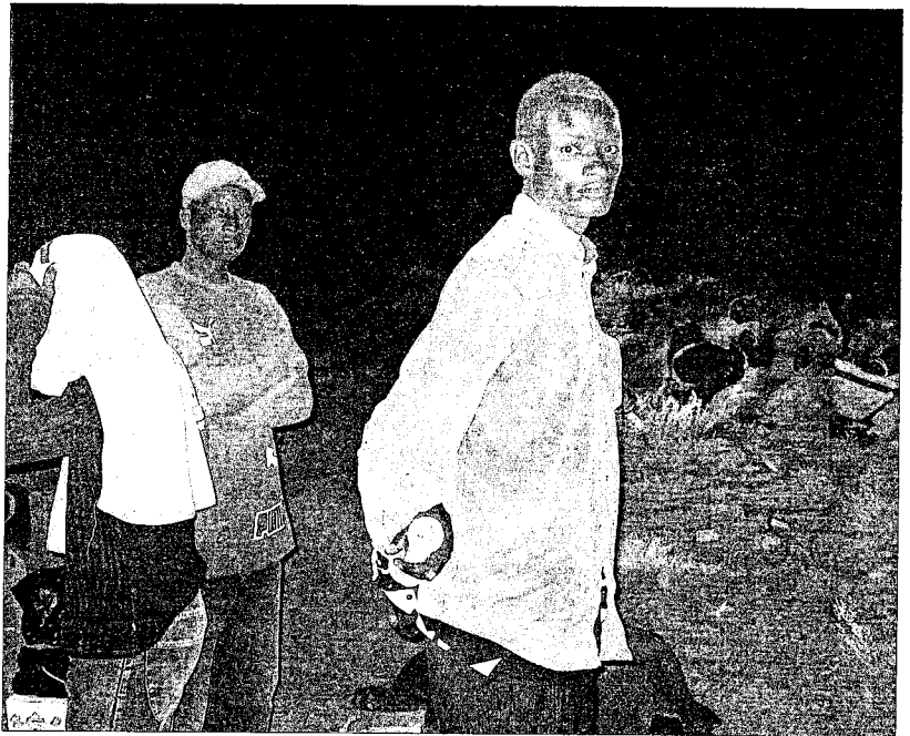
Inmigrantes abandonados por Marruecos en una zona fronteriza situada entre el sur del Sáhara y Mauritania.