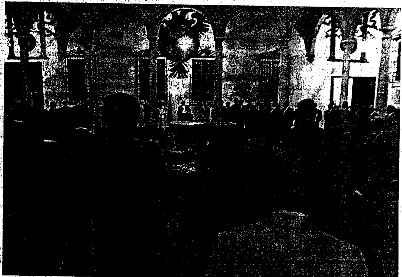
CONCURRIDO. Multitud de jueces y representantes de la sociedad granadina estuvieron en el acto.