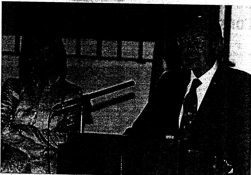
DISCURSO. La consejera de Justicia escucha atenta al presidente, ayer durante el acto celebrado en la Real Chancillería de Granada. ESTHER FALCÓN

El presidente insistió en que el acto de ayer no era de apertura de tribunales en la comunidad andaluza, "pues la Ley Orgánica del Poder Judicial no contempla esa posibilidad", al tiempo que advirtió a los ciudadanos de que los tribunales no comenzaban a trabajar con