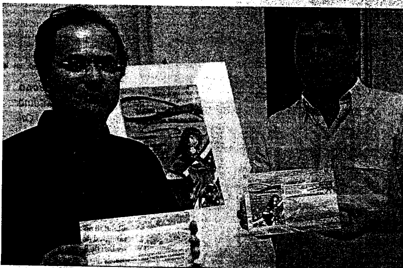
MOVILIDAD. La Asociación Granada al Pedal presentó ayer el primer número de la publicación que edita.

Poesía, viñetas y varios artículos piden la defensa de la Vega y exigen una política urbanística más respetuosa con la naturaleza