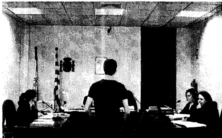
Un acusat, assistit per la seva advocada, declara davant del tribunal durant un judici ■ S.R.

Un 34% més D'aquesta manera, els advocats del torn d'ofici tornen a cobrar al dia, i fins i tot, en part, amb antelació ja que generalment, per aquestes dates de gener, se'ls havia pagat només un