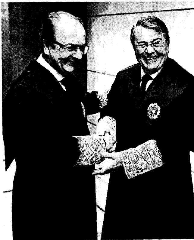
Saludo. El nuevo decano saluda a su antecesor.

Otro de sus retos, a los que también hizo referencia, es su pretensión es contribuir a la adaptación del Colegio y de los abogados va-