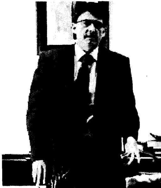
Martín cree necesaria la reforma de la Justicia gratuita. PAGO RODRÍGUEZ

—No debemos a los siete colegios de abogados que hay en Galicia. Se agotó el dinero y hemos pagado el tercer trimestre a cuatro, así que nos quedan tres por pagar. Esas cantidades, que suman casi 1,5 millones de euros, se convalidaron el jueves por el Consello de la Xunta, con lo cual la semana que viene, con total seguridad, se va a pagar ese tercer trimestre. Pero el cuarto trimestre acaba el 31 de diciembre y los colegios no nos hacen la certificación de las cuantías hasta mediados de enero como muy pronto. Y aún no tenemos todas, así que es imposible pagar el último trimestre del año antes de febrero.