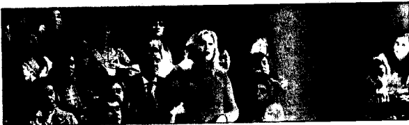
Asambleas de los abogados en los juzgados de Plaza de Castilla.