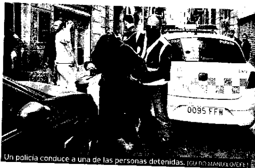
Un policía conduce a una de las personas detenidas.