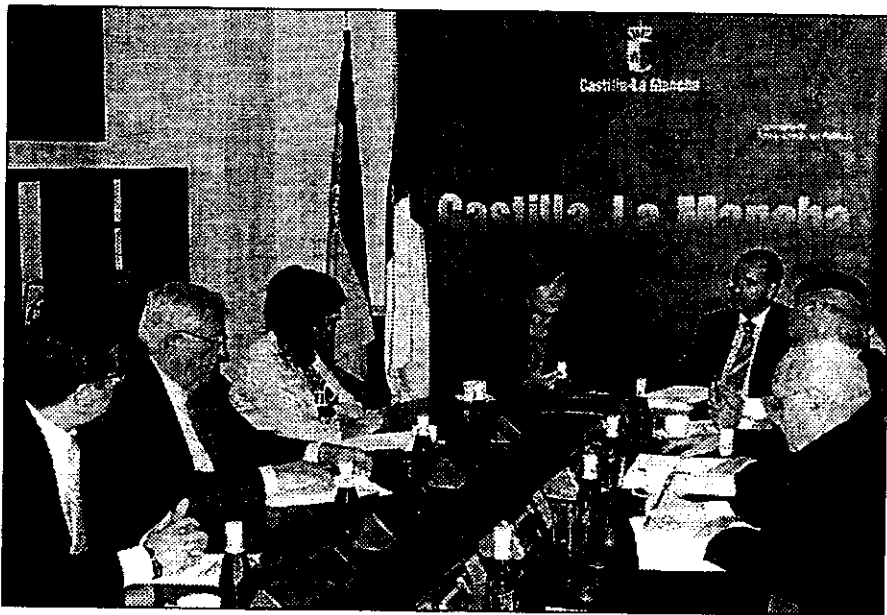
La consejera con los representantes de la abogacía