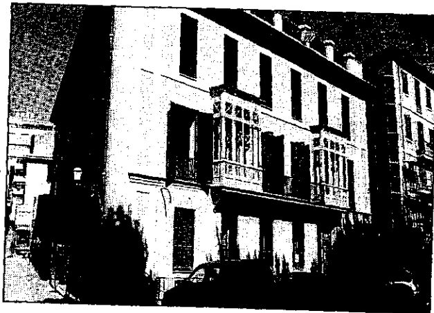
La seu del Col·legi d'Advocats de Palma.

constatat que tant la lletrada com el cap de Policia duïen un ritme de vida que no es corresponia amb els ingressos i ara intenten provar que havien cobrat quantitats milionàries de