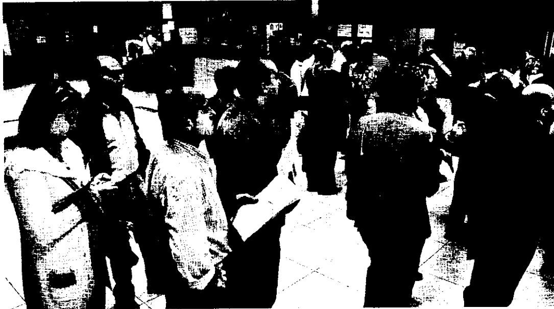
LARGA ESPERA. El público hace cola en unas oficinas del Palacio de Justicia de la capital vizcaína.