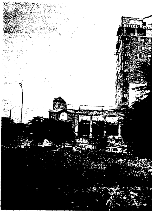
El solar de la Buhaira en el que se ubicará el edificio judicial.

Tomando el mínimo de 12 euros por metro cuadrado al mes en superficie y el máximo de 20, y aplicando el IPC -con una subida anual estimada del 3 por ciento-, el coste total de los cinco años de alquiler