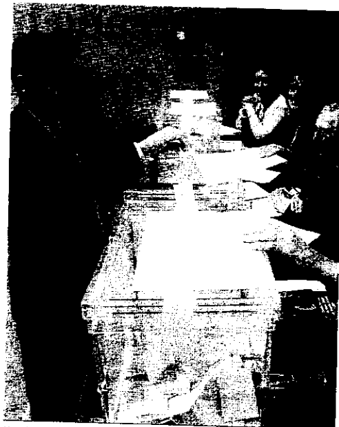
Uno de los electores deposita su voto en la urna.