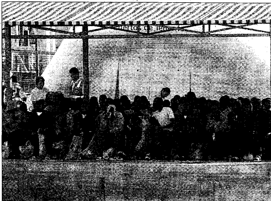
Varios de los 139 inmigrantes que llegaron en un cayuco a Los Cristianos hace varias semanas.

Hay una decena de abogados que han interpuesto hasta veinticinco recursos (se abona cada uno en torno a los 190 euros) en una única jornada de guardia, lo que sumado al pago de la guardia en sí (otros 190 euros), supone una ganancia de 4.940 euros en un día. El caso más llamativo es el de un abogado gomero que pretende percibir