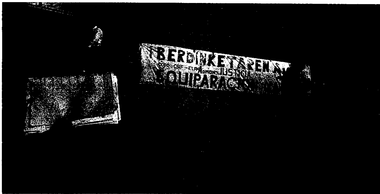
Un cartel en el Palacio de Justicia de San Sebastián recuerda a profesionales y usuarios que los funcionarios de Justicia están en huelga. [MIKEL FRAILE]