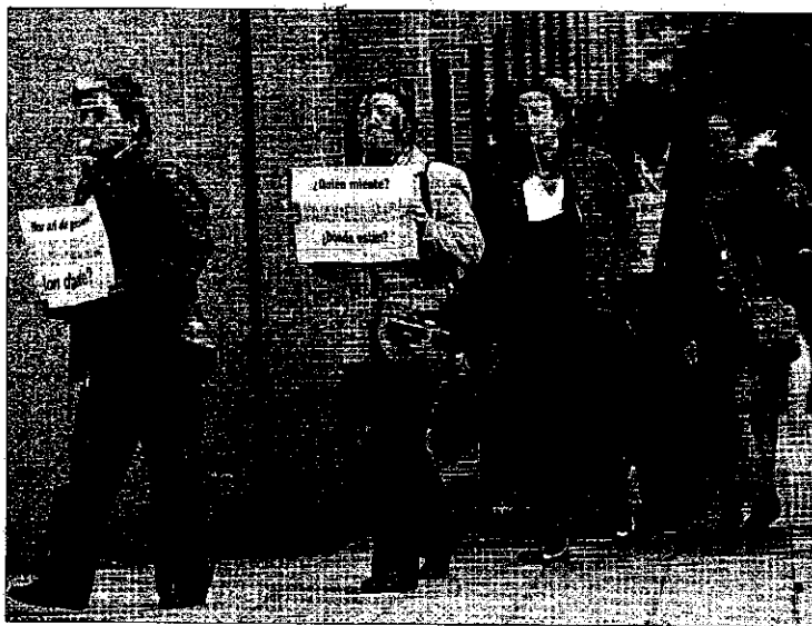
Una de las protestas que los trabajadores de Justicia han realizado en Bilbao ante la sede del Superior.

El segundo instrumento que el departamento puso en marcha para intentar frenar los efectos de la huelga, la orden del 27 de noviembre que amplía el número de trabajadores que deben cumplir servicios mínimos, fue rechazada por la Sala de lo Contencioso del Superior. El tribunal estima que no es justificable ampliar la dotación de personal para los servicios mínimos cuando no ha habido una modificación de los parámetros de la huelga.