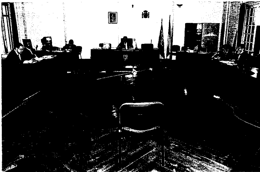
EXPERIENCIA. Los letrados que más dificultades encuentran a la hora de trabajar son los que llevan más de seis años en ejercicio.