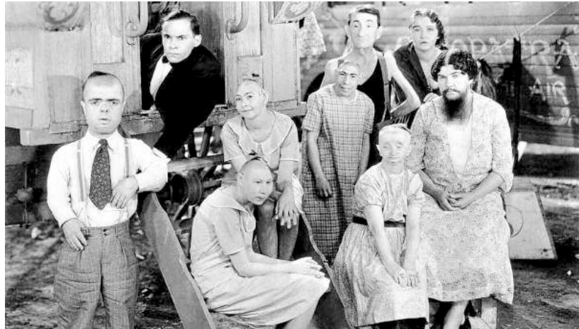
Un fotograma del filme 'Freaks'.