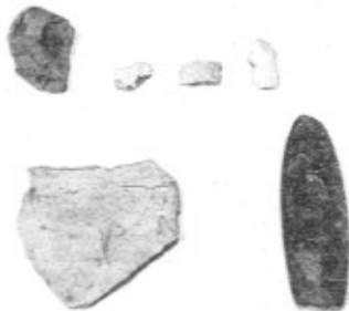
Imagen de restos encontrados en la cueva en la mañana de ayer

El yacimiento conserva unas galerías con pinturas parietales que datan del periodo denominado Magdalenense (Paleolítico Superior) entre 12.000-14.000 años de antigüedad. Las pinturas representan dos figuras femeninas (una de ellas pendiente de confirmar) a las que se ha dado la denominación de «Venus Egabrense».