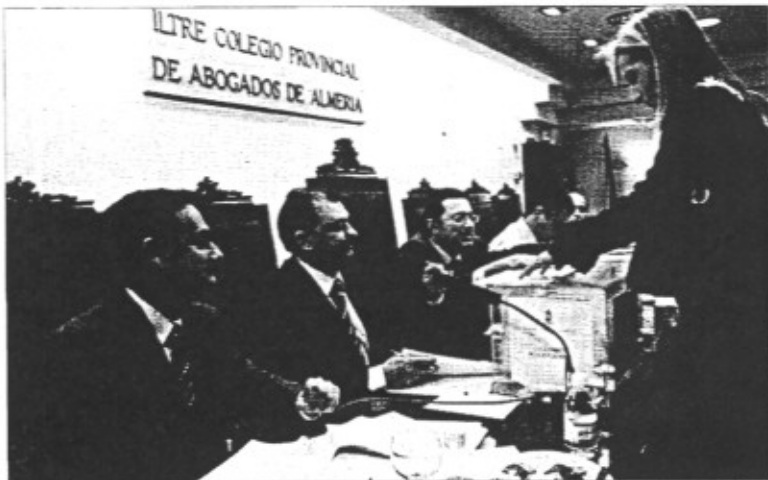
Los abogados votaron durante toda la mañana de ayer en la sala de juntas para elegir a su decano.

A las diez de la mañana se abrían las urnas. La cita electoral parecía que no iba a ser muy secundada, pero conforme transcurrían las horas los