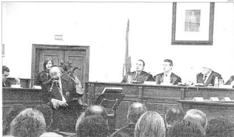
►► Un momento del acto del colegio de abogados.