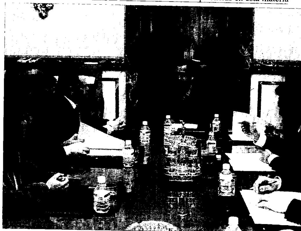
Reunión entre el Ejecutivo regional y el Ministerio de Justicia para negociar las transferencias.

Por otro lado, el Gobierno de Cantabria está realizando en los últimos meses un completo diagnóstico de los sistemas de información de la Administración de Justicia para fijar las necesidades a corto, medio y largo plazo a todos los niveles admi-