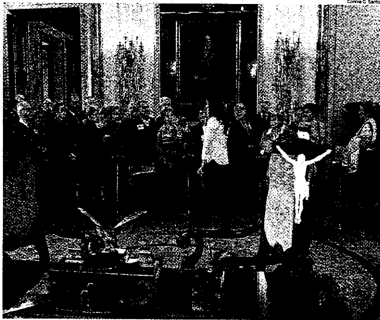
El Crucifijo también está presente en las dependencias del Tribunal Supremo

Sin embargo, ese mismo precepto también recoge que «haciendo honor a sus tradiciones seculares, el Colegio mantendrá los patronatos y conmemoraciones que han acom-