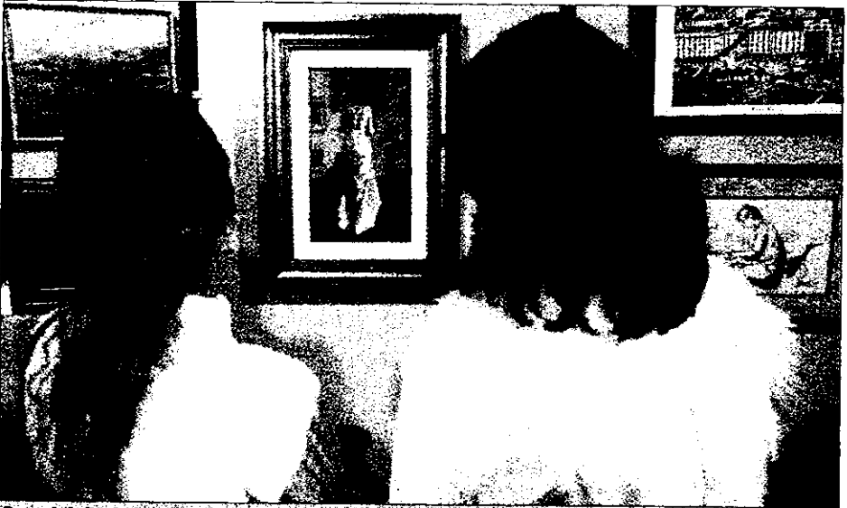
Paseo de la Farola. La muestra 'física' pueda visitarse en el Colegio de Abogados de Málaga hasta el 18 de enero. ANTONIO RAMOS

La Fundación de Asistencia a Enfermos de Cáncer inaugura una exposición benéfica de pintores malagueños, cuyos cuadros se subastan por Internet