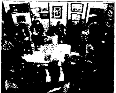
Colectiva. Una participación de la exposición.

mos de Cáncer tiene la sede en la calle Denis Belgrano, 19 y nació con el objetivo de complementar la asistencia médica con la asistencia psicológica a los enfermos de cáncer y a sus familiares. En la actualidad atiende de forma gratuita a 850 enfermos en terapia individual y a otros 4.200 gracias a los 25 voluntarios con los que cuenta en las unidades de oncología y hospital de día del Clínico. ■