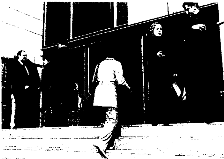
Entrada al Palacio de Justicia de Donostia, que intenta recobrar la normalidad tras la huelga. (MIKEL FRAILE)

► «Se ha desaprovechado una ocasión de arreglar el problema de la organización de la Justicia»