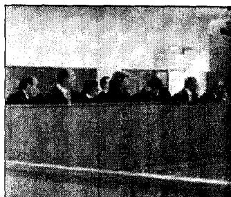
ABOGADOS DE LA CIUDAD. ARCHIVO.