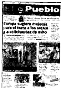
PORTADA DE HOY