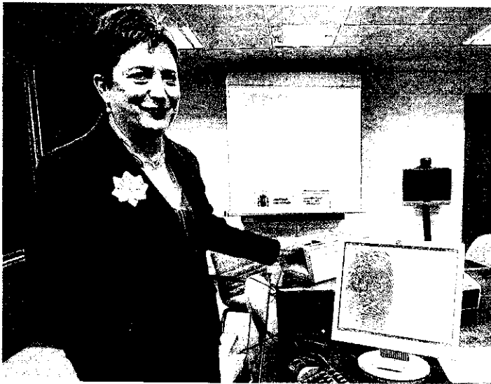
La directora de Prisiones con el nuevo sistema de identificación de reclusos

La partida cada vez más frecuente de este tipo de embarcaciones desde países del África subsahariana, responde a intereses económicos. Los asiáticos, una vez en África, se disponen a cruzar hacia Canarias en barcos de este tipo que salen de países, cuyas respectivas autoridades tratan a los buques con diferente criterio pero idéntico fin: el económico. Mientras algunos gobiernos toleran que los buques usen sus puertos a cambio de dinero, otros tratan de evitar que surquen sus aguas, motivados por las compensaciones que la UE destina a sus arcas a condición de que lo impidan.