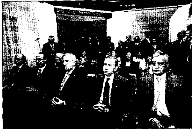
Momento de la toma de posesión de su cargo como decano