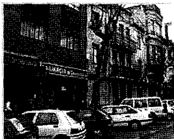
Actual sede del Colegio de Abogados en la avenida Virgen de la Montaña.