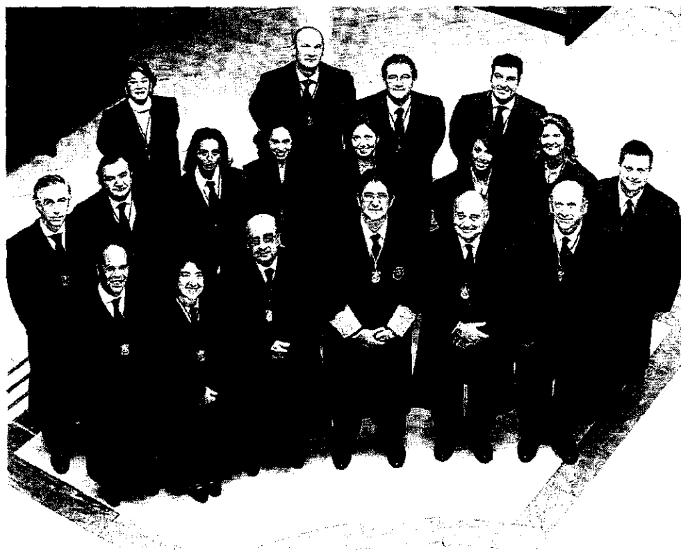
En la imagen, la nueva junta de gobierno del Colegio de Abogados;

A lo largo de la junta general de toma de posesión —durante la que se aprobaron las cuentas del ejercicio 2006—. el decano reseñó los acontecimientos más importantes acaecidos en el Colegio durante el pasado año, señalando que «durante 2006 se celebraron en la sede colegial un total de 256 actos de contenido jurídico y social, lo que evidencia la vitalidad de la institución».