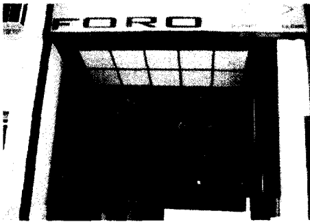
Colegio de Abogados de Guadalajara.

El objetivo principal es agilizar los trámites de la asistencia jurídica gratuita. No obstante, cualquier ciudadano podrá solicitar aquí una certificación catastral