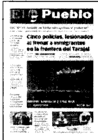
PORTADA DE HOY