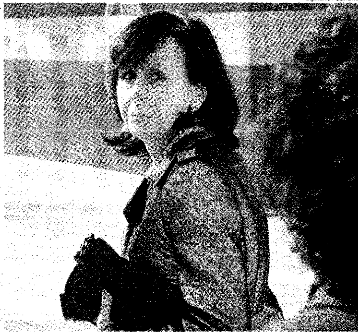
María Emilia Casas, presidenta del Tribunal Constitucional

Para ello, esgrime que las normas que establece la Ley General de la Seguridad Social en esos apartados son consecuencia «del principio de contributividad que informa el sistema de Seguridad Social español,