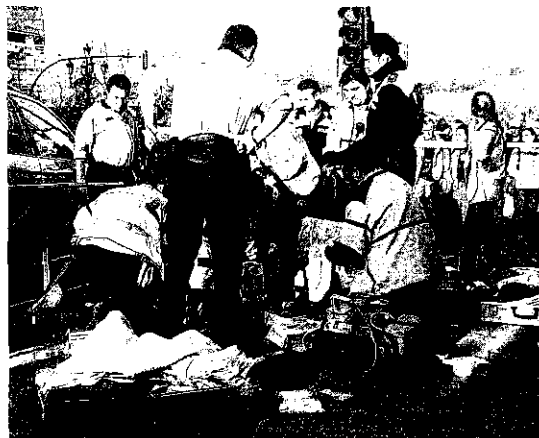
El equipo de emergencias tratando de reanimar a la joven apuñalada