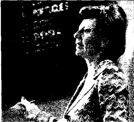
Neelie Kroes, comisaria de la Competencia de la Comisión.

En la carta remitida a los colegios profesionales de abogados, arquitectos, aparejadores, auditores e ingenieros se ha solicitado un informe sobre las medidas adoptadas para eliminar las listas de baremos. Estas obligaciones tuvieron su origen en agosto