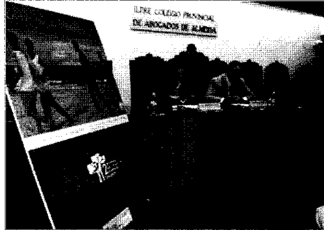
Inicio del curso