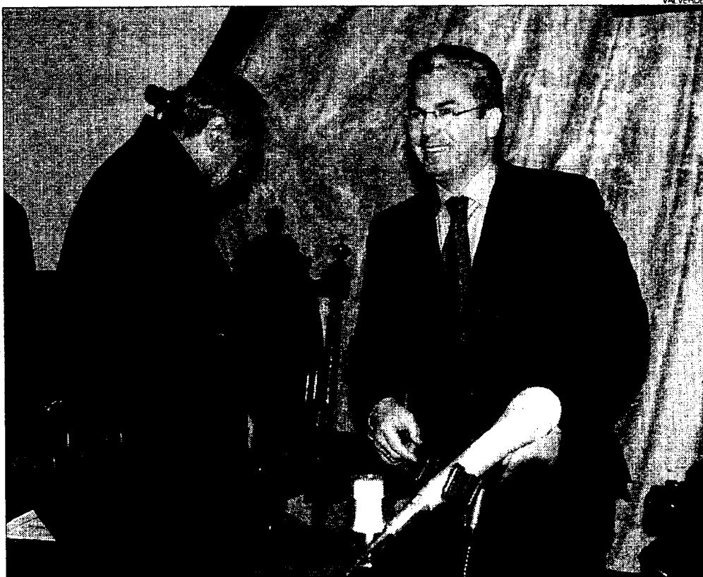
El juez Garzón, en un acto en la Universidad de Salamanca en enero del año pasado.

Por lo que respecta a la jornada del viernes, se espera la llegada (todavía sin confirmar) del nuevo ministro de Justicia, Juan