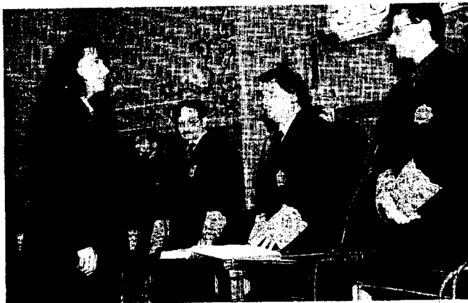
Guillem Vidal, presidente del TSJC, en el juramento de nuevos jueces

El conseller Vallés aseguró, al finalizar el acto de juramento de los 38 nuevos jueces de Cataluña al que asistió, que «la cifra de 266 millones de euros es desorbitada» y que «se ha consultado