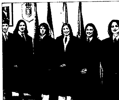
■ Seis nuevas letradas se incorporaron en El Ejido