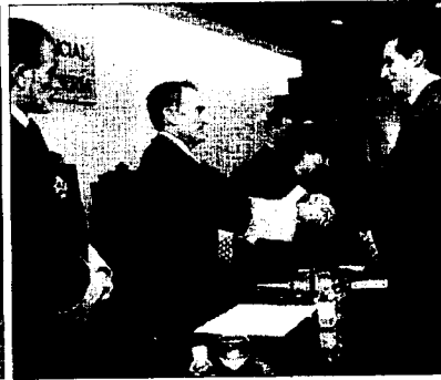
■ Un momento del acto, en el Colegio de Abogados.