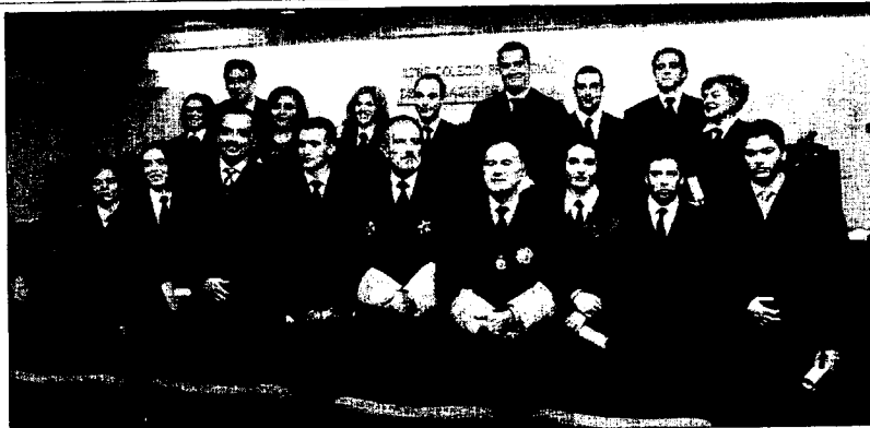
■ Quince nuevos abogados juraron ayer, en el salón de actos del Colegio de Abogados.