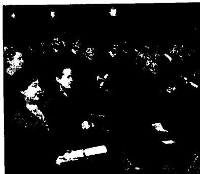
■ Al acto acudió un gran número de personas.