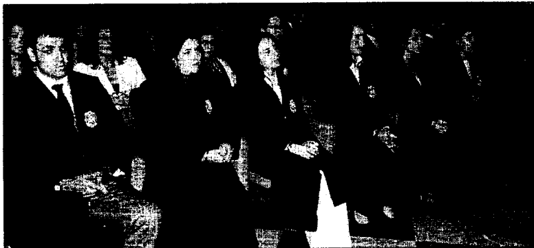
Los nuevos fiscales que ejercerán en Málaga y Cádiz, ayer en la sede del TSJA en Granada.

García Calderón se dirigió a los nuevos fiscales para recordarles que ellos tienen el privilegio