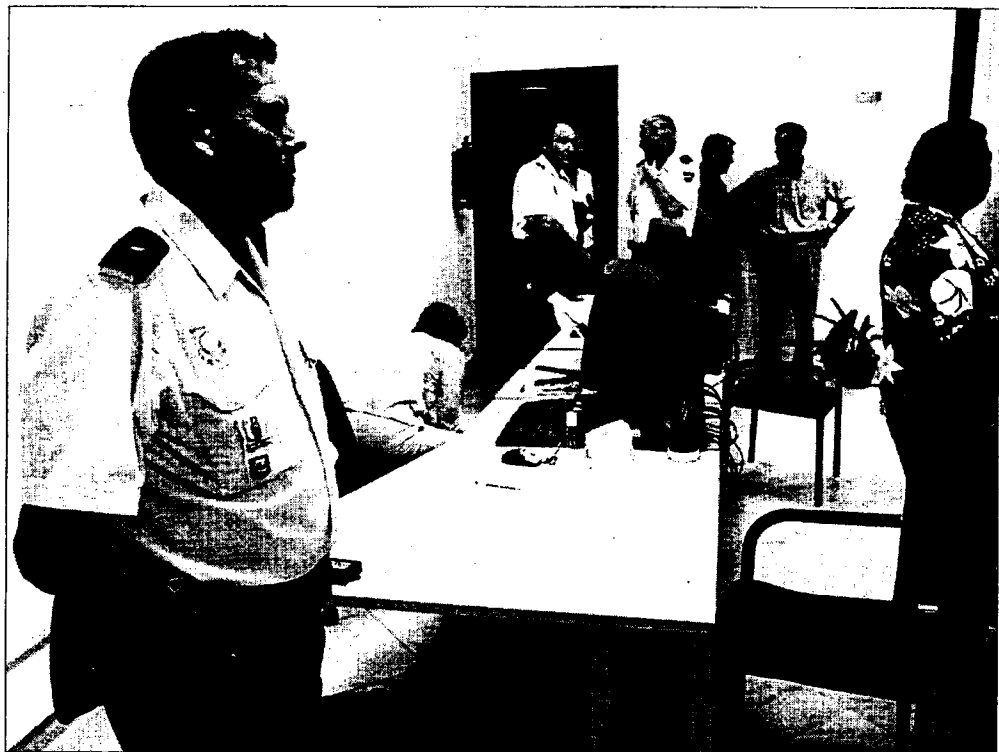
Sólo están ocupadas cinco de las 20 plazas disponibles para atender casos de malos tratos.

Y son muchos los incumplimientos que se están produciendo en los últimos tiempos: "cuando una persona va a mon-