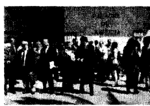
La concentración.

El Colegio de Abogados de Cádiz convocó en la jornada de este miércoles a sus colegiados en San Fernando ante las puertas del Palacio de Justicia, sito en la plaza de San José, para protestar por la situación judicial que tienen que soportar los profesionales de este sector en la localidad isleña.