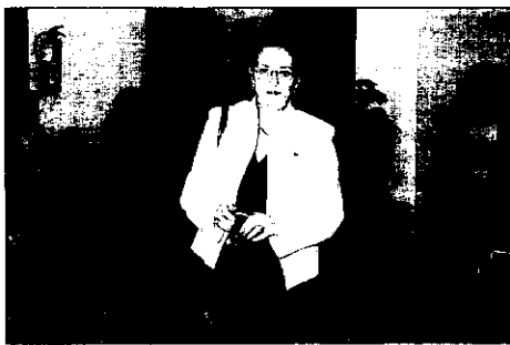
Amelia Valcárcel, consejera de Estado y catedrática de la UNED

La consejera de Estado y catedrática de filosofía moral y política de la UNED, Amelia Valcárcel destacó el problema que supone la aparición de un nuevo tipo de violencia de género entre las generaciones más jóvenes «por un mal entendimiento profundo de la idea de igualdad», que deriva en que las chicas jóvenes no saben enfrentarse a este tipo de violencia. Se trata de un problema que «hace veinte años no existía por la sencilla razón de que las mujeres habían sido socializadas para soportar la violencia de sus compañeros». Valcárcel estimó que en España puede haber unos dos millones de mujeres víctimas de violencia de género y constata que el fenómeno se da en mayor medida entre el colectivo inmigrante.