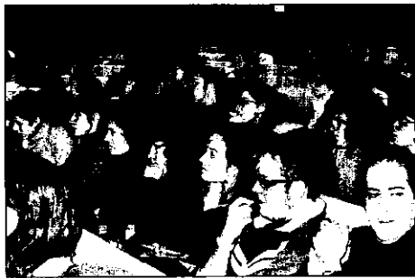
Asistentes al congreso, en el salón de actos del Campus Viriato

conjunto de la Comunidad Autónoma «de los cuales diez fueron en la provincia de Zamora. Que puedan acceder a un puesto de trabajo muchas veces es la mejor terapia que podemos hacer para las mujeres víctimas de violencia de género». El convenio establecido