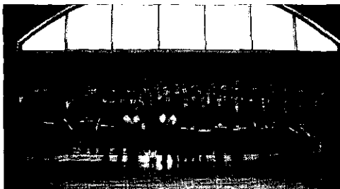
Los nuevos letrados posan con sus diplomas tras la ceremonia.