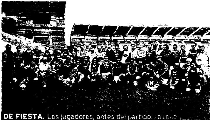
DE FIESTA. Los jugadores, antes del partido. / BILBAO