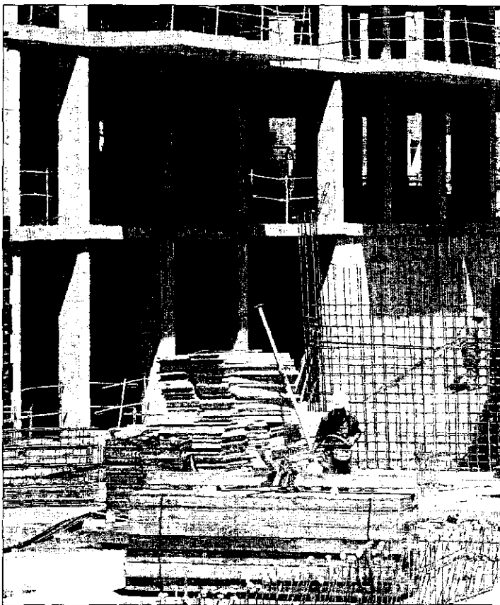
Negocios inmobiliarios. El precio medio de la vivienda en Málaga ya ha alcanzado los 300.000 euros. e t

Hasta ahora, esta información se ponía en conocimiento tanto de la Junta de Andalucía como de Hacienda de forma mensual o a re-