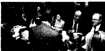
VOTACIÓN. Varios colegiados depositan su sufragio en la urna. Detrás de ellos, la larga cola que se formó al mediodía para votar.

El ganador partía con la ventaja del apoyo de un ex decano, Justo de Diego. Ahora tendrá que cumplir lo prometido, entre otros objetivos, la sanción de aquellos colegiados que, teniendo recursos, no paguen la cuota: el mantenimiento de la asamblea permanente, con convocatoria de elecciones inmediata; y el alquiler de la tercera planta del colegio como uno de los ingresos que posibilite la reducción de las mensualidades que pagan los colegiados.