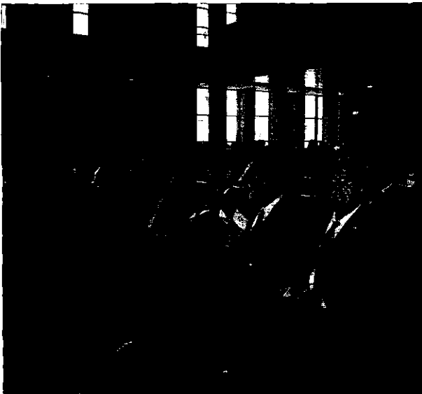
Numerosos asistentes se dieron cita en el Paraninfo de la UC.