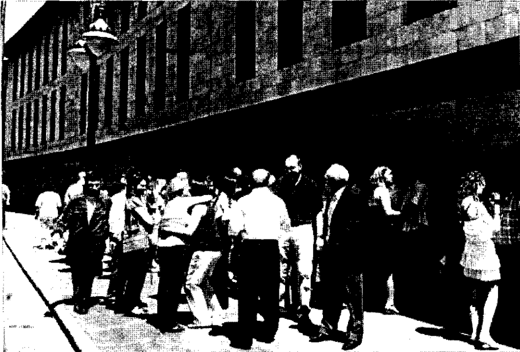
Los invitados de una boda se mezclaban con los citados a juicios a la puerta de los Juzgados en la calle Angustias, cerrados ayer por el derrumbe del techo.