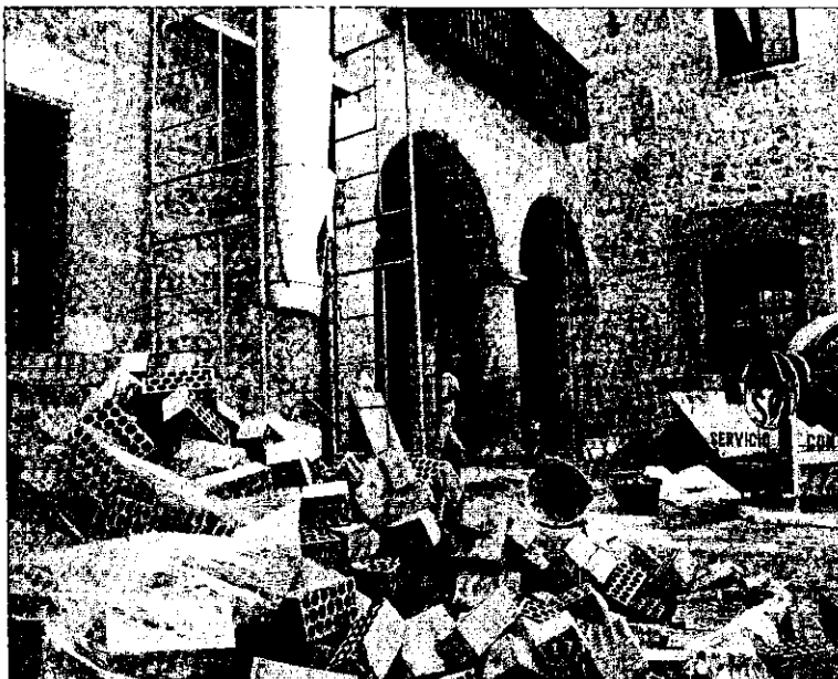
Obras en el palacio de Justicia de Soria.

Añadió que la resolución de los casos también es «fluida gracias a la llegada del juzgado número tres». Esto ha dado lugar a que la resolución en el tiempo de espera de juicios y sentencias sea más rápido.