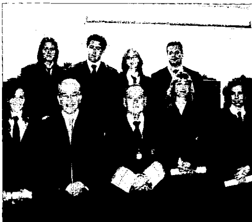
Los siete nuevos letrados tras jurar su cargo.