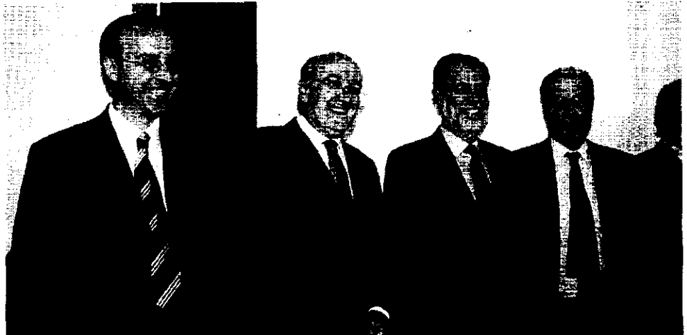
Las autoridades, durante el acto oficial.

Como novedad, en esta edición se establecieron dos categorías: la de profesionales en activo, dirigida a licenciados en Derecho con edad inferior a 26 años, y la de estudiantes de último año de carrera de cualquier universidad española o extranjera con expediente académico de notable. Los premios recayeron,