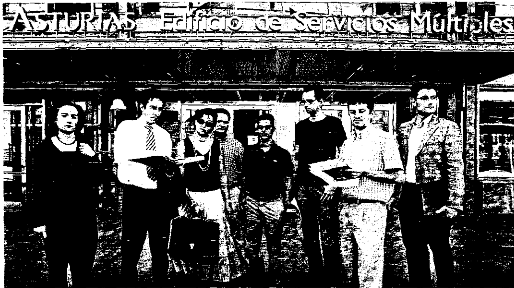
EN EL EASMU. Los abogados jóvenes presentaron el 30 de julio 300 solicitudes para reclamar el adelanto del pago.