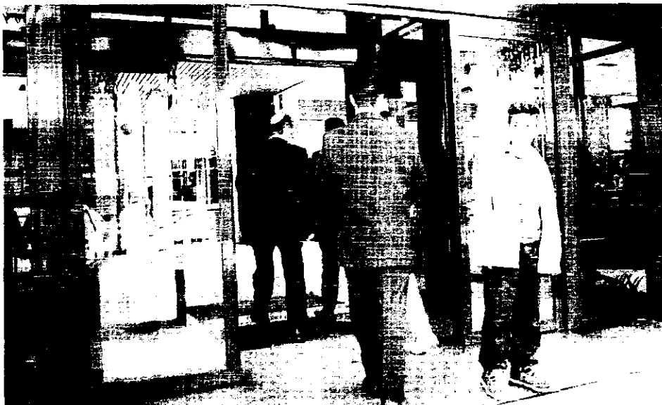
Varias personas acceden a los juzgados del edificio Viapol, en una imagen de archivo.