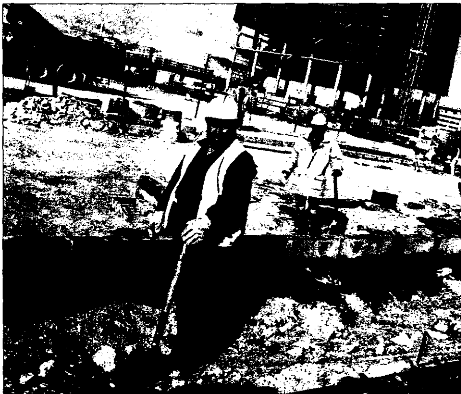
La "tarjeta azul" o permiso de trabajo europeo pretende hacer más fácil la entrada y las condiciones de residencia para los inmigrantes altamente cualificados.

Esta tarjeta otorgará al inmigrante el derecho de trabajar en la UE por un periodo de dos años renovables