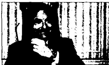
Franco Frattini.

vechosa para Europa y, por ello, queremos crear canales legales. La cooperación con los países de origen es la única manera de tener éxito. Es de nuestro interés común promover el crecimiento local en los países terceros", apuntó ayer Frattini en la reunión de Lisboa, en la que participaron mi-