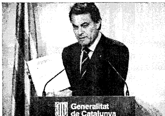
Artur Mas presenta, ayer, su Plan de Gobierno.

José Montilla, que era presidente de la Generalitat cuando el Constitucional dictó el fallo, propuso recuperar los aspectos en materia judicial eliminados del Estatut