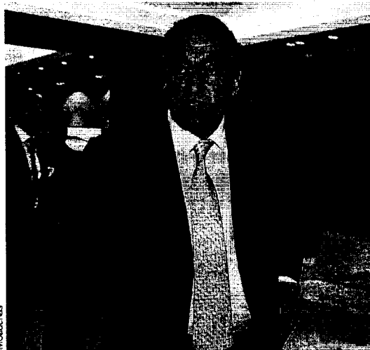
El presidente de CEOE, Juan Rosell.

En este punto, CEOE quiere que, pasado un tiempo sin acuerdo para renovarlo -un año-, el convenio pierda toda su vigencia y se obligue a las partes a negociar uno nuevo. Los sindicatos quieren garantizar que se mantienen los de-