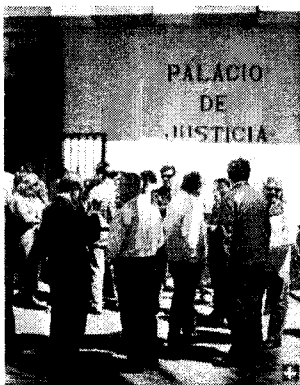
Acto de protesta organizado por el Colegio de Abogados hace dos semanas, a las puertas de la sede.

El propio Tribunal expone en el informe que se trata de "una mínima propuesta de creación de órganos judiciales" atendiendo a los recortes presupuestarios motivados por la crisis económica, las medidas de austeridad adoptadas por la Administración y, por otro lado, por la reforma legislativa pendiente. Para esta propuesta, en la que se incluye a San Fernando, se ha valorado la carga de trabajo que soportaron los distintos órganos judiciales en el año 2010 en relación con los años anteriores. Es decir, se ha tenido en cuenta el hecho de que