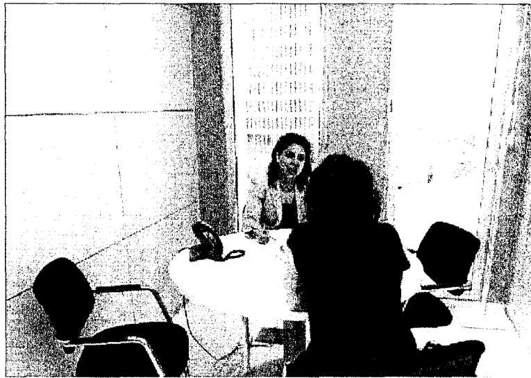
Una abogada atiende a una de sus clientas en los despachos del nuevo centro.

De momento, se está promocionando el servicio con paquetes comerciales que incluyen el alquiler de un despacho —que puede lucir incluso el nombre del letrado en la puerta— por horas o días y que dispone de la atención al cliente que asumen las recepcionistas. También existe la posibilidad de alquilar lugares de trabajo y salas de reuniones o polivalentes por horas. El gerente del Centro de Apoyo, Francesc Carbo, explica que se espera que muchos abogados que alquilan de forma esporádica se conviertan en clientes permanentes. Destaca que cada vez se ofrecerán más servicios como la venta de togas, su gestión para guardarlas y llevarlas a tintorerías o el acceso a la biblioteca con numerosas publicaciones jurídicas. Carbo también considera que el centro permite a los abogados «interactuar» entre ellos y que la proximidad con la Ciutat de la Justicia lo hace interesante para «atender a los clientes con total confidencialidad». Por eso recomienda a los interesados que «vengan y lo vean».