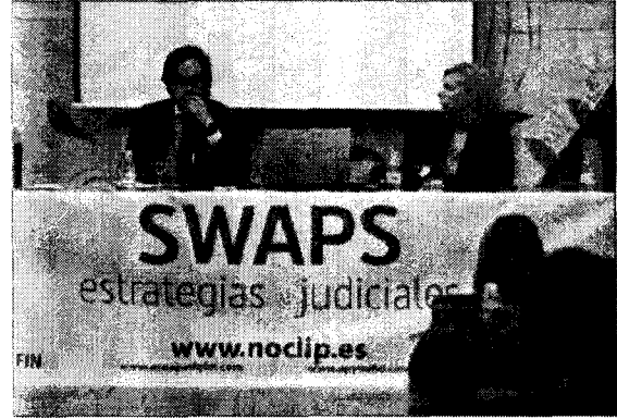
La jornada se celebró ayer en la Universidad. - norberto

Apenas un 10% de los afectados por los swaps (derivados financieros comercializados por las entidades financieras bajo la apariencia de seguros contra las subidas hipotecarias) han demandado a sus bancos y cajas, a pesar de que casi 250 sentencias dictadas hasta ahora dan la razón a los usuarios. Las estrategias judiciales para hacer frente a estos productos fueron analizadas ayer en una jornada organizada por la Asociación de Usuarios Afectados por Permutas y Derivados Financieros (Asuapedefin), en colaboración con el Colegio de Abogados, la Escuela de Práctica Jurídica de León y el Centro de Estudios Especializados en Formación y Práctica Jurídica de la Universidad.