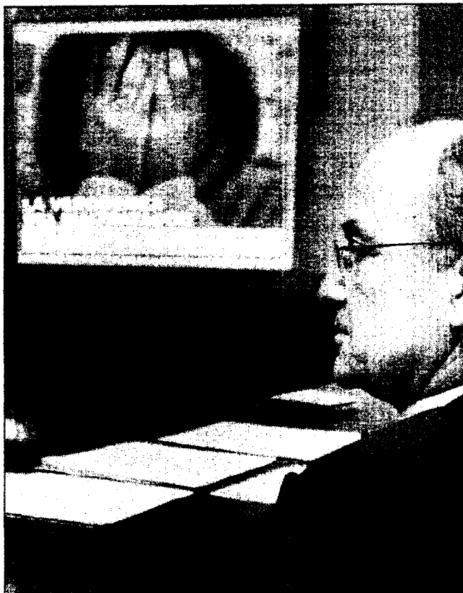
El presidente de la Audiencia, en la presentación del programa

El proyecto, que comenzará el próximo 20 de mayo, contará con la presencia de 8 hombres condenados por primera vez por agresiones contra su mujer, a los que se les suspenderá cautelarmente la pena para que puedan asistir a estos cursos de formación. Además, Magro defendió la utilidad del programa asegurando que muchos jueces de Alicante ya habían pedido en sus sentencias cursos para la reeducación de estos agresores. «Lo que hemos hecho ahora es dotar de infraestructura y medios a esta solicitud», comentó ayer. Magro también confirmó, tal y como publicó este periódico, que los cursos estarán abiertos también a maltratadores no condenados a los que se les in-