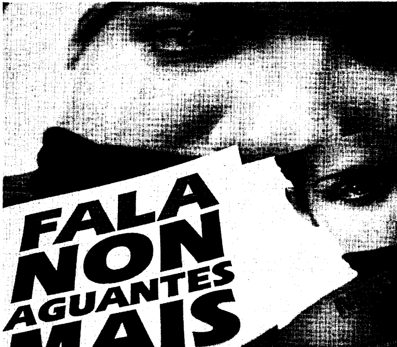
Carteles contra los malos tratos del Consello de Pontevedra.

El tramo de edad de las mujeres que acuden a este novedoso servicio de asistencia jurídica se extiende desde los 17 años hasta los 68, desde la menor de edad que es golpeada por su padre, hasta la mujer viuda que recibe malos tratos por parte de su actual compañero sentimental. En la mayoría de los casos, los abogados de Pontevedra prestan asistencia en los juicios de faltas, en los que hasta