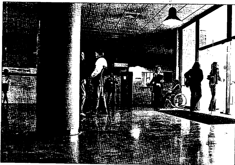
En los juzgados de las islas trabajan unos 900 funcionarios.

El Ministerio ha dispuesto que los funcionarios que en el plazo establecido no remitan, en el caso de Baleares, al director de Relaciones