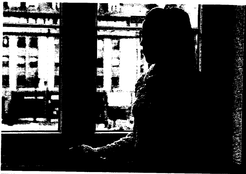
TEMOR. Una mujer maltratada que denunció las agresiones de su marido.

Los datos son preocupantes. La violencia doméstica provoca la muerte de más de una mujer cada