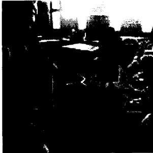
Los juristas piden una reflexión sobre el contenido de la ley.

Un grupo de reconocidos juristas se mostraron ayer partidarios de la creación de la ley integral de violencia doméstica, pero han advertido de la necesidad de que previamente se realice una profunda reflexión sobre su contenido para que cubra todos los ámbitos.