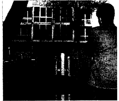
ANTIGUA SEDE. Una mujer observa el edificio donde se ubicaba el Juzgado de Instrucción número 2.

Las reacciones no se han hecho esperar. Según el decano del Colegio, «en ningún caso se ha actuado con la necesaria ecuanimidad». Por ello, en la Junta de Gobierno del día 18 se acordó remitir una carta al TSJ, expresando el malestar del