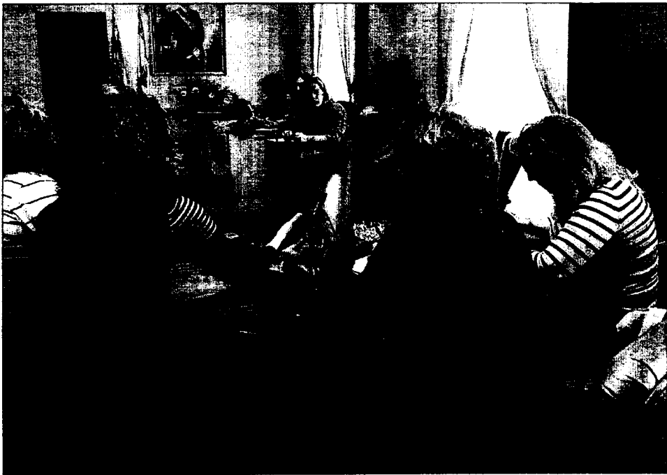
Etelvina Andreu, subdelegada del Gobierno en Alicante, reunida ayer con asociaciones de mujeres.

El foro, que extenderá su campo de acción a la violencia familiar hacia menores, mayores y personas dependientes en general, tendrá carácter consultivo y como lugar "de debate y de ideas", del que surjan propuestas dirigidas a las diversas administraciones. Trabaja en cinco áreas: investigación —analizar las causas, y consecuencias o el seguimiento de los procesos judiciales—, sensibilización —campañas publicitarias—, prevención —estudio de asignaturas de igualdad—, protección —propuestas de modificaciones legislativas en leyes penales, civiles y laborales— y formación —se crearán programas específicos dirigidos a jueces, fiscales, profesores o policías, entre otros, para hacerlos miembros activos en la lucha contra la violencia de género—.