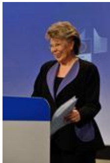
Viviane Reding, Vicepresidenta de la Comisión Europea, responsable de Justicia, derechos fundamentales y Ciudadanía