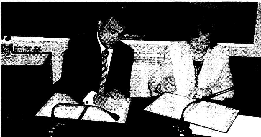
La consejera de Justicia y Protección durante la firma del convenio.

La consejera de Justicia y Protección de la región lo dio a conocer en el día de ayer