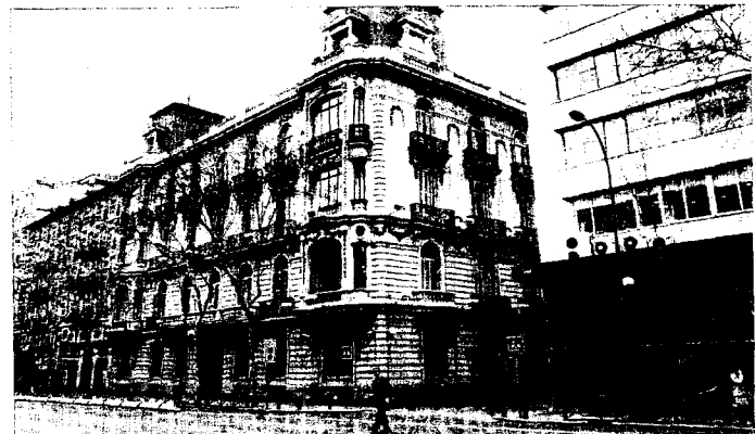
Sede del colegio de abogados de Madrid, en la calle Serrano.

Destaca claramente por el uso de las tecnologías de la información, tanto para conseguir el respaldo de sus compañeros para acceder al decanato, como para mejorar los servicios y la formación de los letrados.