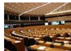
Convocatoria del Parlamento Europeo para Abogados españoles