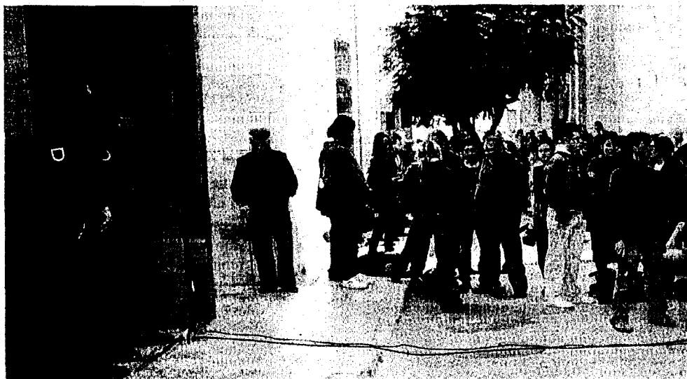
EXPECTACIÓN. Los periodistas aguardan ante el Ayuntamiento de Totana, el pasado día 28, cuando fue