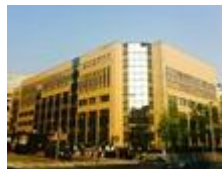
El Consejo de la UE aprueba formalmente la Directiva de acceso al Abogado

El Consejo de la UE ha aprobado formalmente la propuesta de Directiva de la Comisión Europea que garantiza a todos los ciudadanos el derecho a ser asistido por un abogado en los procesos penales y por Orden de Detención Europea. Previamente, el pasado 10 de septiembre, el Parlamento Europeo celebró una votación que dio luz verde a la Directiva. Esto significa en la práctica que todo sospechoso tendrá a partir de ahora derecho a asistencia letrada, desde las fases más tempranas del proceso hasta su conclusión, en cualquier punto de la Unión Europea. Las nuevas normas aseguran además que tras su detención, los sospechosos puedan ponerse en contacto con su familia y, si están en el extranjero, dirigirse al consulado de su país. La Directiva, cuyo borrador presentó la Comisión Europea en junio de 2011, se publicará dentro de unas semanas en el Diario Oficial de la UE, tras lo cual los Estados miembros dispondrán de un plazo de 3 años para incorporarla a su legislación. Se calcula que, tras su entrada en vigor, la norma se aplicará a unos 8 millones de procesos penales al año en los 28 Estados miembros. Esta Directiva forma parte de una Hoja de Ruta sobre los derechos en los procesos penales, acordada por el Consejo de la UE en noviembre de 2009, que establece una serie de propuestas con el objetivo de establecer unos estándares mínimos comunes en los derechos de los sospechosos y acusados en procesos penales y en el que el Consejo de la Abogacía Europea trabaja intensamente.