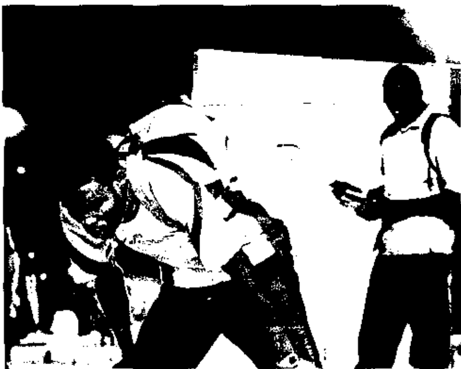
Dos inmigrantes venden discos en una calle de Alicante.

Por el contrario, la tesis mayoritaria es la que aplicó el juez en el caso de Ndiaye: "El acusado actúa con ánimo de lucro, pues la venta [de CD y DVD] constituye el medio de vida en nuestro país [...] y la conducta se lleva a cabo en perjuicio de un tercero. Las organizaciones que ostentan las legítimas