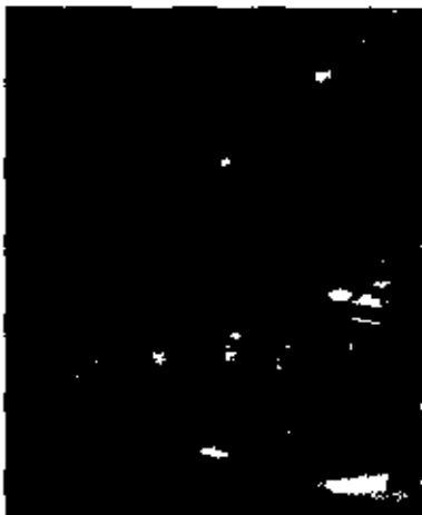
Vista exterior de la biblioteca de Uria Menéndez.

Madrid y Barcelona han tenido un año tranquilo, sin grandes traslados