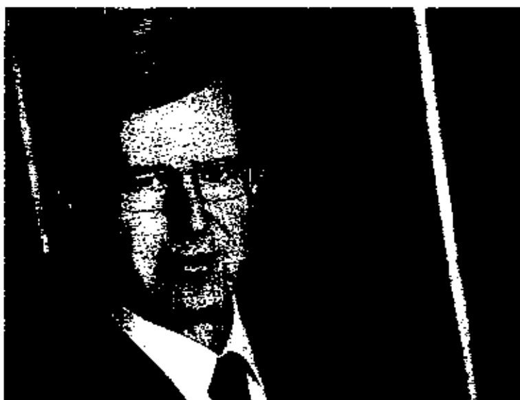
«DE JOVEN hace baloncesto. Ahora también practico el tenis y el bádminton»

-Tenemos un servicio médico que da una cobertura prácticamente completa a nuestros colegiados. Contamos aproximadamente con