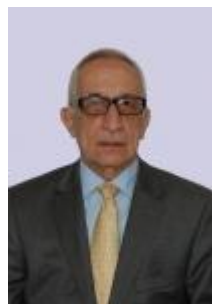
Evangelos Tsouroulis, Presidente de CCBE en 2013

El Consejo de la Abogacía Europea (CCBE), se ha mostrado alarmado ante revelaciones recientes sobre la vigilancia sistemática de los ciudadanos europeos por parte de sus gobiernos, pidiendo a las instituciones europeas que defiendan la confidencialidad de las comunicaciones abogado-cliente. Los informes de violaciones masivas del derecho fundamental a la privacidad indican que las comunicaciones protegidas por el secreto profesional se han visto igualmente afectadas. Las preocupaciones de CCBE han quedado recogidas en un nuevo posicionamiento, aunque la UE y sus Estados miembros han fallado a la hora de abordar de manera satisfactoria estas alegaciones respecto al derecho a la vida privada recogida por los artículos 7 y 8 de la Carta de Derechos Fundamentales de la UE y la Directiva 1195/46/CE de Protección de Datos. CCBE recuerda la sentencia del TJUE en el asunto AM&S, de 1982, que aborda el tema de la confidencialidad, que implica el derecho de cualquier persona a consultar a un abogado, y a la protección de la confidencialidad de las comunicaciones entre abogados y clientes, inherente a la naturaleza misma de la profesión de abogado, y que contribuye a mantener el Estado de Derecho y el respeto al derecho de defensa. CCBE urge a las instituciones europeas a actuar protegiendo la confidencialidad de los intercambios entre un abogado y su cliente usando todos los medios a su alcance, incluyendo instrumentos de Derecho europeo e internacional.