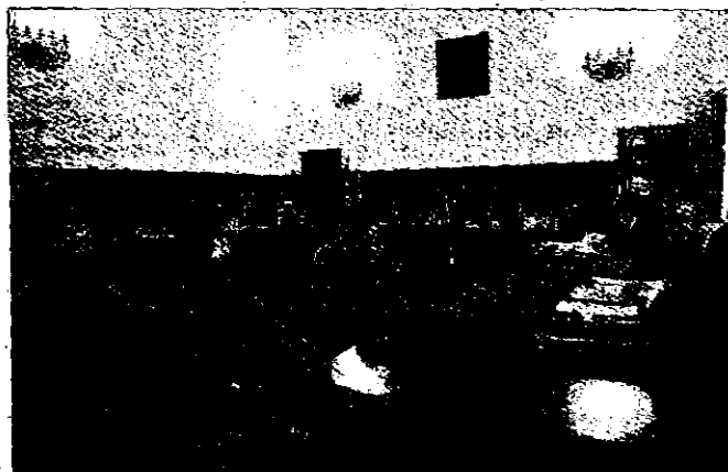
»» Solo se dota a la sala con uno de los tres jueces.

El decreto del BOE incluye una exposición de motivos correcta sobre la creación de nuevas unidades judiciales en Zaragoza por la celebración de la Expo, que el Gobierno debe de impulsar «con la finalidad de que la planta judicial sea idónea para aten-