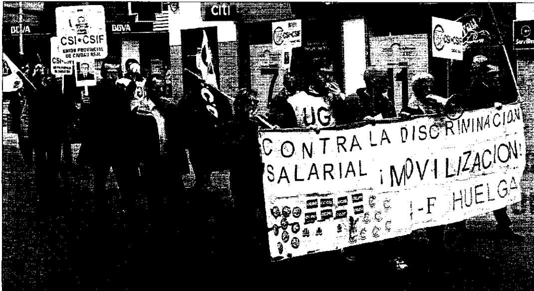
Los funcionarios de justicia, de huelga indefinida desde el día 4, volvieron ayer a manifestarse por las calles de Ciudad Real