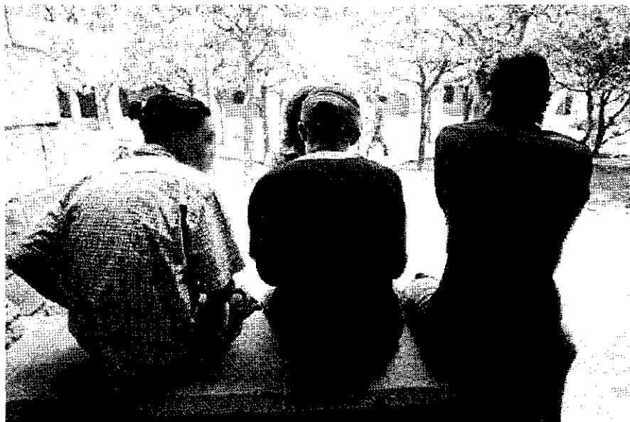
A la imatge, menors immigrants no acompanyats, retratats en un carrer de Barcelona.