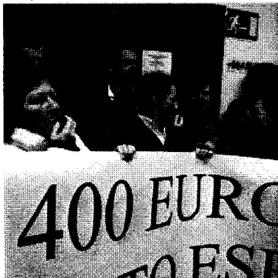
La huelga continúa.

La duración de la reunión entre el secretario del Ministerio de Justicia y los diferentes representantes sindicales -más de dos horas- era una "buena señal" para los empleados ceutíes, tal como afirmaron en declaraciones a 'El Faro' minutos antes de que finalizara el encuentro. Sin embargo, el resultado de la reunión es el mismo, ya que el Ministerio presentó la misma propuesta, aunque deja la Mesa de Negociación abierta y se volverá a reunir con los sindicatos mañana a partir de las 18:30 horas.