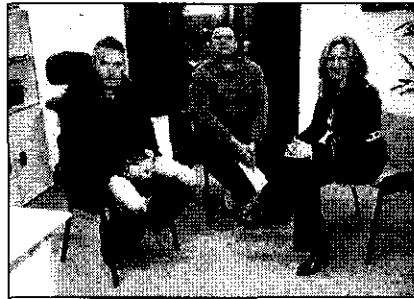
Trinidad Jiménez mantuvo una reunión con dos delegados de los funcionarios en huelga

Ayer se celebró en Palma una concentración sindical delante de los juzgados civiles. Luego hubo una protesta ante la Delegación del Gobierno y una concentración enfrente de la sede del PSOE.