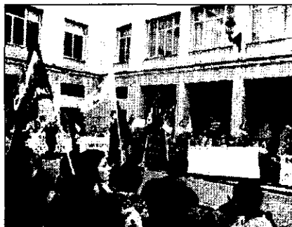
Los empleados de Justicia, concentrados ante la Delegación del Gobierno.

Este apoyo explícito de los jueces -algunos ya lo habían expresado a título personal a los funcionarios- llega en un día en que los trabajadores volvieron a manifestarse por las calles de Oviedo para reclamar la subida de 200 euros que, según señalan, prometió el presidente José Luis Rodríguez Zapatero. La manifestación tuvo lugar poco antes de las once de la mañana, después de una asamblea en el edificio de la Audiencia Provincial en la que los representantes sindicales apelaron a la unidad para ganar la huelga.