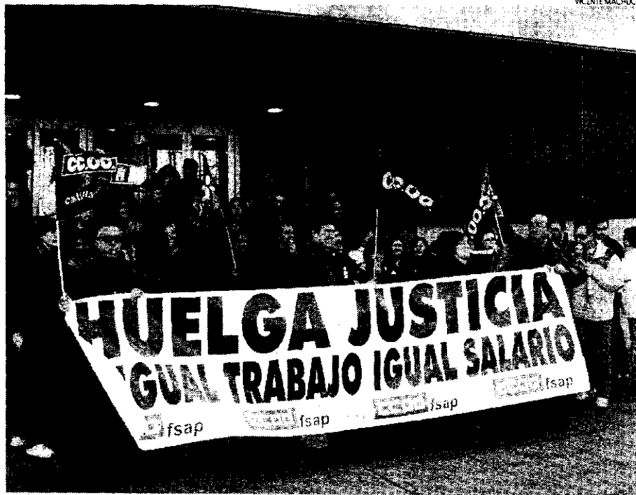
La huelga indefinida de funcionarios de Justicia ha provocado la suspensión de todas las actuaciones judiciales.

Colegios de abogados y procuradores han manifestado su malestar por la situación